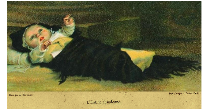
Peint par L. Duboump.